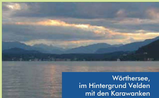
Wörthersee, im Hintergrund Velden mit den Karawanken