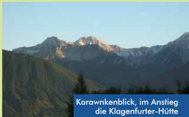
Karawnenblick, im Anstieg die Klagenfurter-Hütte